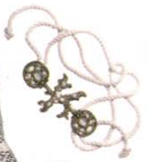
Ceinture en corde à boucle métal, Kenzo, 775 €.

S ur le bitume abandonné, coquillages, crustacés, et tout autre détail flirtant franchement avec l'idée d'escapade ensoleillée sont les meilleurs amis des modeuses. Cet été, hippocampes et autres étoiles de mer délaissent leur habitat naturel pour un environnement beaucoup moins pur, mais néanmoins élégant : notre dressing. On croyait ces animaux, et toutes les couleurs et imprimés qui vont avec, réservés aux pires heures d'exposition, de midi à seize heures, portés les doigts de pied en éventail avec une bonne dose de crème solaire. Eh bien, non. Même en ville le nez pollué par les gaz d'échappement, on a droit à sa dose de cocotiers. Comme ça, même dans les bouchons, il suffit d'un regard au coucher de soleil de notre T-shirt pour voyager, direction Copacabana et son rivage accueillant. Pratique. Mais, pour éviter de se retrouver hors sujet en total look de surfeuse dans le métro, on décale et on s'inspire des propositions de Miuccia Prada. La prêtresse du style ponctue sa collection d'un imprimé exotique, certes très carte postale, mais sur une veste et un short coupés bords francs aux lignes affûtées. Exit le premier degré. Oui à la robe courte estivale, en jean comme Emmy Rossum, ou façon kimono au motif aquatique à la manière de Whitney Port. On troque aussi la paire de tongs contre des clerbys, un panier en osier contre un sac seau en cuir et on joue avec sa ceinture pour apporter de la structure à l'ensemble. A nous la beach life version city. •