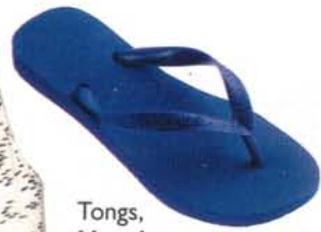
Tongs, Havaianas, 16 €.