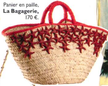
Panier en paille, La Bagagerie, 170 €.