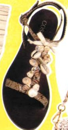
Sandaes à coquillages, CosmoParis, 69 €.