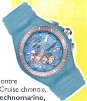
Montre «Cruise chrono», Technomarine, 385 €.