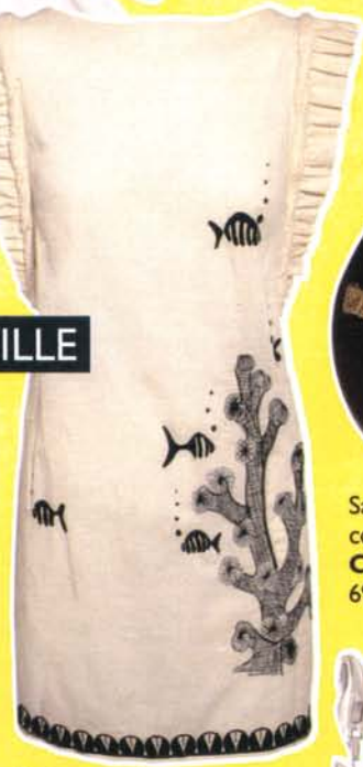
Robe en coton rebrodé, Hoss Intropia, 139 €.