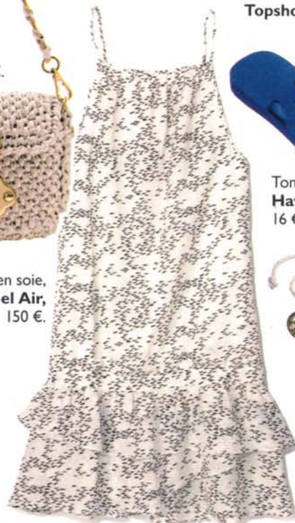
Robe en soie, Bel Air, 150 €.