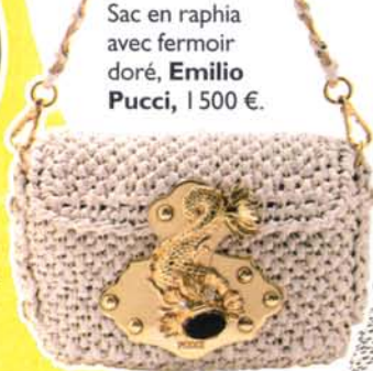
Sac en raphia avec fermoir doré, Emilio Pucci, 1 500 €.