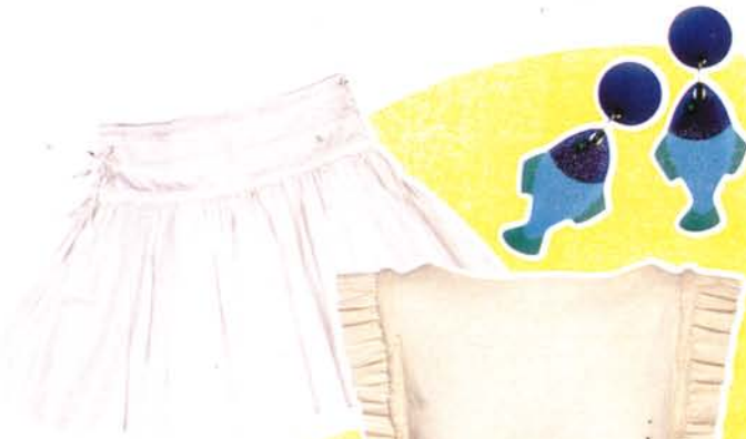
Jupe en coton, Euridif, 20 €.