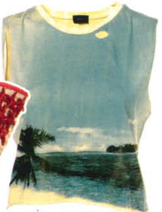
T-shirt en coton imprimé, Topshop, 20 €.